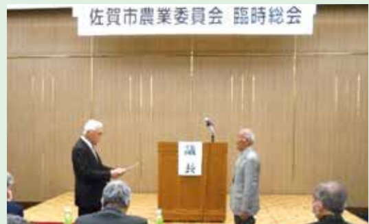
令和6年4月1日に開催した佐賀市農業委員 会の臨時総会において、農地利用最適化推進 委員への委嘱状の交付を行いました。