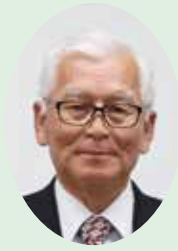
佐賀市農業委員会