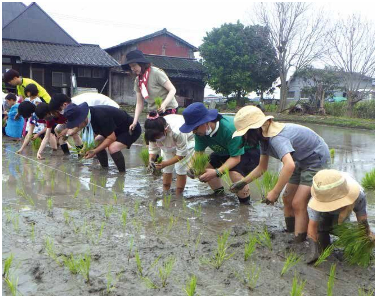
写真／ほんなもんぼ体験学校(田植え／巨勢ほ場)