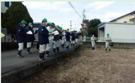
農業委員会では、転用許可申請等に関し、 必要に応じて「現地調査」を実施しています。 (写真は、南部調査会による現地調査の様 子)

今後も引き続き、当農業委員会は、農地の 利用集積・集約、遊休農地の発生防止・解消、 農業への新規参入の促進に努め、本市農業 の維持・発展のために尽力して参りますの で、皆様のご支援をよろしくお願ひします。