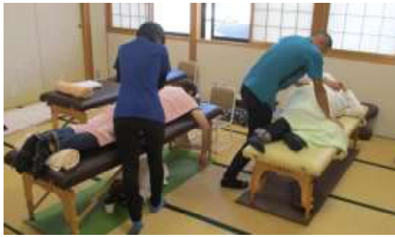
整体・リラクゼーション