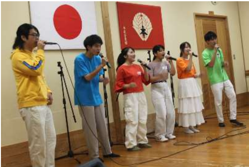
音（アカペラ演奏）に合わせて運動会

ブース出展 : 佐賀大学 FT 団体 Sharearth:コーヒー、フェアトレード商品 サヴァキッチンカーcafe:スカッシュ、サイダー、冷製焼き芋 ジンのキッチンカー:カレー、から揚げ、フライドポテト、アメリカンドック (NPO)居場所そら:缶バッジづくり、ドリンク (福)スプリングフィールド:缶バッジ・キーホルダーづくり、雑貨 (福)はびねす:木工品、いちごさんサイダーゼリー等 (福)ワークスペースかん:たこ焼き、お菓子