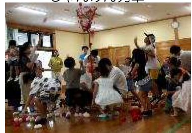
チェチェコリ玉入れ