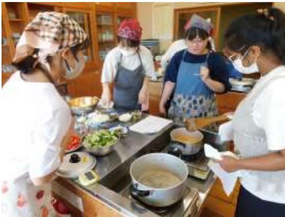
スリランカカレー料理教室