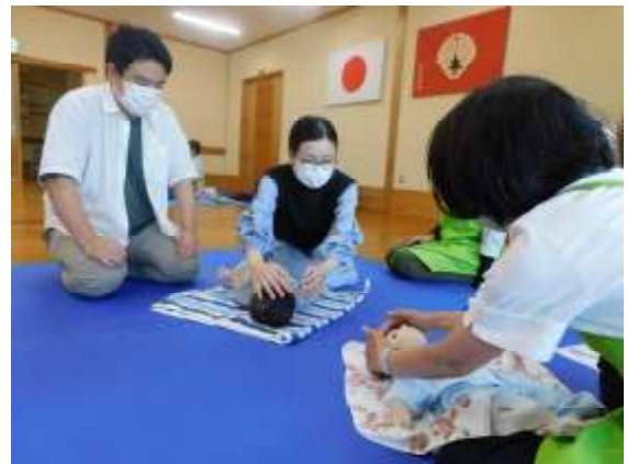
赤ちゃんタッチケア相談