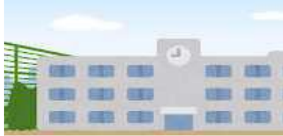
佐賀市教育委員会学校教育課