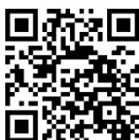
佐賀市HP（部活動改革）

【発行・お問い合わせ】 佐賀市教育委員会 教育総務課 電話：0952-40-7352 E-mail：kyouiku@city.saga.lg.jp