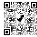
総合型地域スポーツクラブ