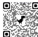
市内スポーツクラブ一覧

中学生が求める文化・スポーツ活動は「競技志向」と「エンジョイ志向」に二極化しています。一方で、市内にはすでに多くのクラブが活動しています。中学生それぞれが自らの志向に応じて活動を選択し参加することができる環境を構築するため、部活動以外の活動フィールド（クラブ・スクール、体験イベント情報）を情報提供する準備を進めています。