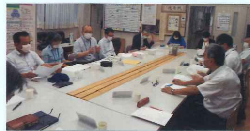
中学校区学校運営協議会(校区内の小中合同)

【委員】地域住民・保護者・校長・教職員・学識経験者・関係行政機関の職員 地域学校協働活動推進員・対象校の運営に資する活動を行う人など