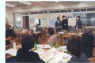
学校運営協議会(小学校)