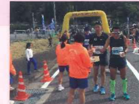
地域のマラソン大会 (中学生ボランティア)

地域は、学校運営や学校教育に参画することで、地域の特色を理解し、郷土を愛する次世代の担い手を育み、未来を託すことができます。