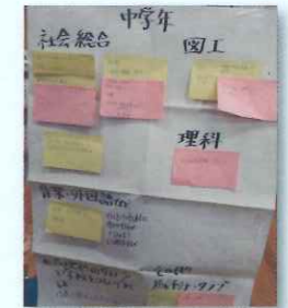
グループのアイデア