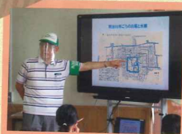
お堀のハスの再生