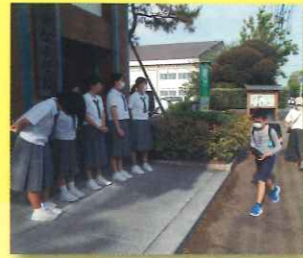
出前あいさつ運動 (中学生が出身小学校で実施)

子どもたちは、多様な知識や技術を身に付けたり、地域の人とのふれあいを通して、ふるさとの良さを感じたりすることで自分の未来を切り拓く力を養います。また、様々な課題を抱えた子どもたちは、多くの大人が見守ったり、力を貸してくれたりすることで、安心して学習や生活を行うことができます。