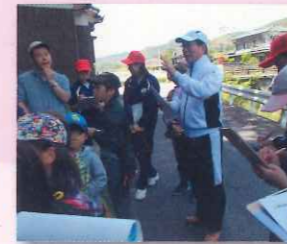
小中合同の郷土学習 (校区内ウォークラリー)