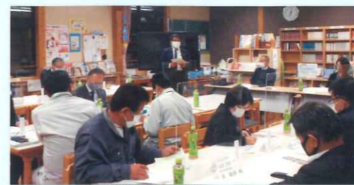
学校運営協議会(小中一貫校)