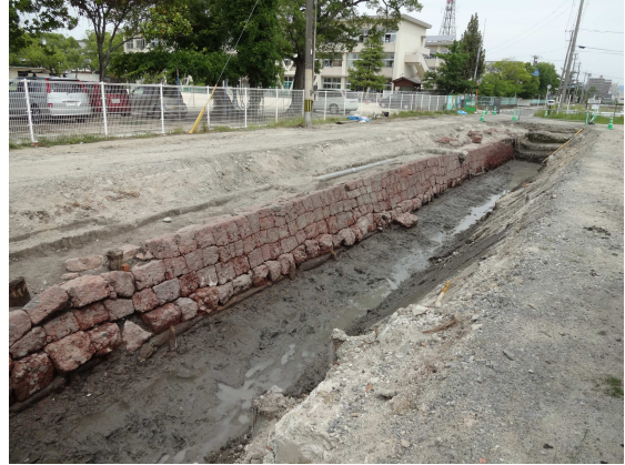
検出された赤石石塼（東堀側・南から）