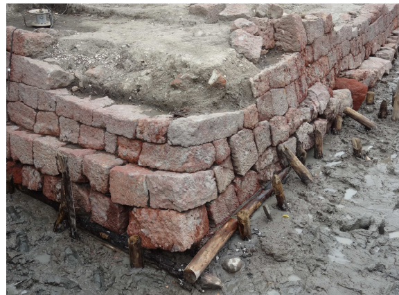
東南隅の石積状況