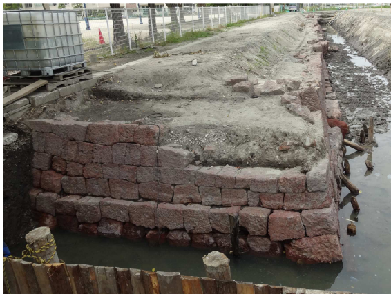
検出された赤石石塼（南堀側）