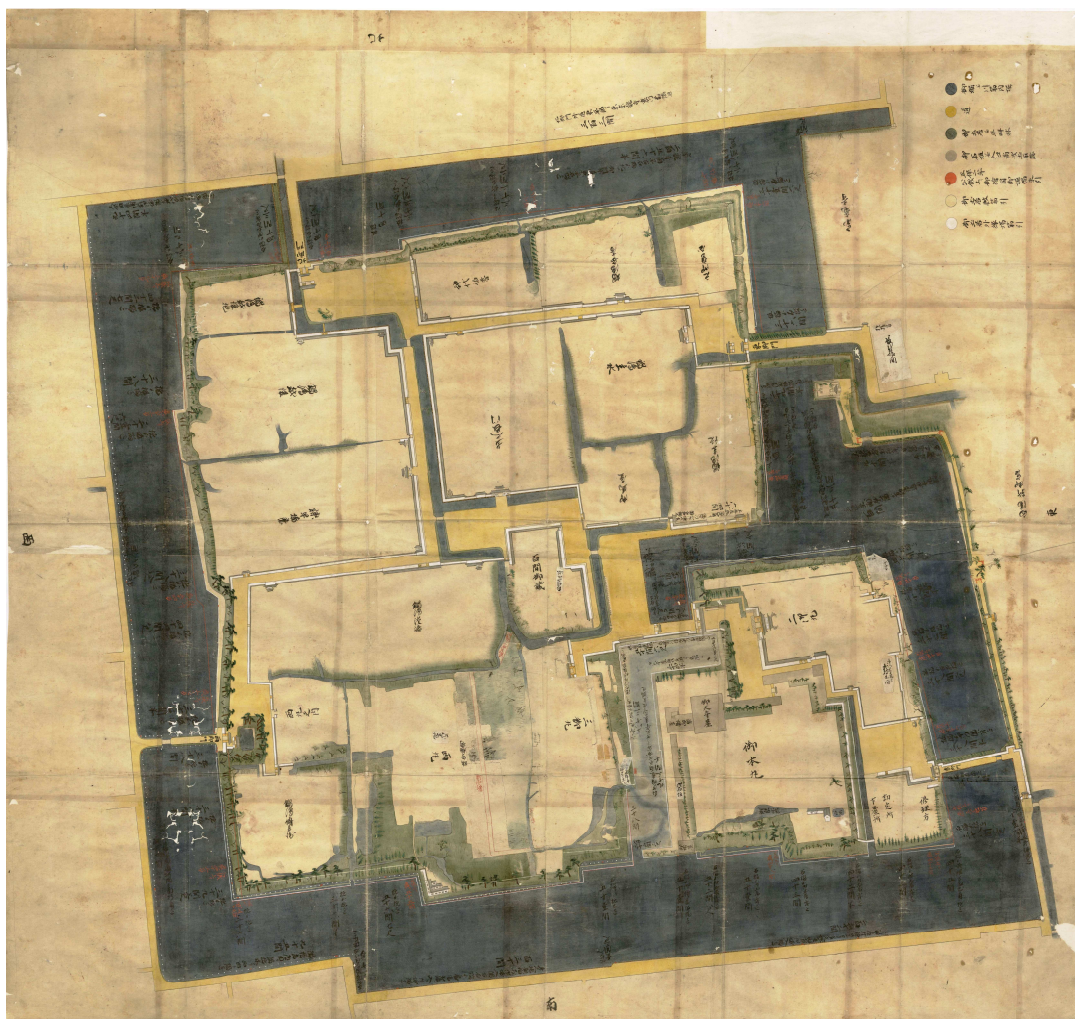
「御城分間絵図」

佐賀城東堀は明治に部分的な埋め立てが始まり、昭和14年までにはすべての部分が埋め立てられてしまいました。北堀・西堀・南堀も近現代に行われた各種開発によって埋め立てが進み、西堀の一部のみが唯一往時の姿をとどめています。