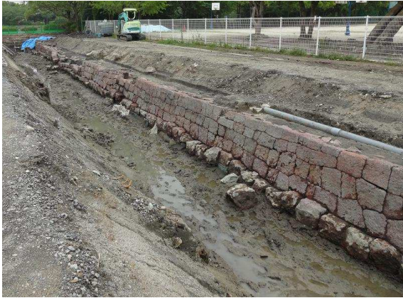
検出された赤石石塼（東堀側・北から）