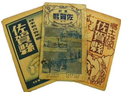
昭和12年の地図ほか

ひぜんこくちやうあとしりやうかん 肥前国庁跡資料館では、令和3年から小学校の学習に役立つ、 がくしゅう やくだ 昔の道具の展示を開始しています。今回は、令和3~4年中に てんじ かいし こんかい 寄贈を受けた、きょうかしょ しりやう あら 教科書などの資料を新たに展示しています。