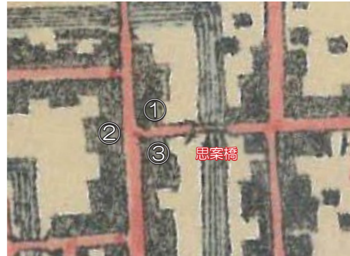
佐賀近傍之圖 第一号 明治23年(1890)8月製図 第六師団参謀部発行