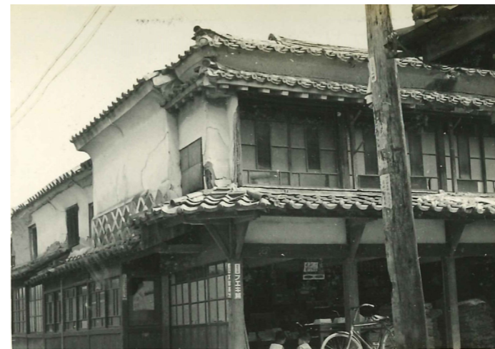
材木町 鳥屋 (昭和30年撮影)