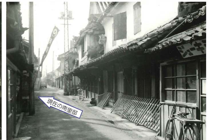
材木町の一角に往年の佇を止む (昭和39年撮影)