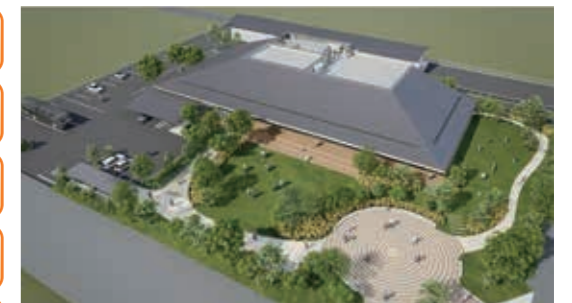
東名遺跡ガイダンス・埋蔵文化財センター(仮称)イメージ