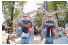
国指定重要無形民俗文化財 白鬚神社の田楽