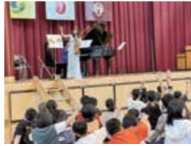
アウトリーチ事業