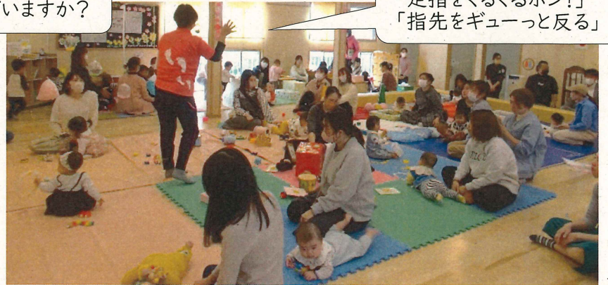
足指マッサージについて