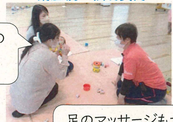
講座後は個別質問