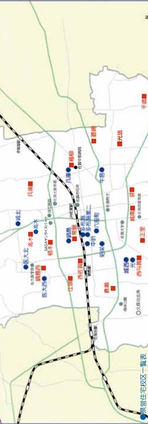
■ 県営住宅校区一覧表