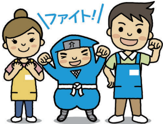
佐賀の介護事業所リサーチャー 「介の助（かいのすけ）」