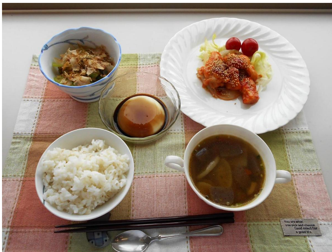
男性レシピ(令和4年度)