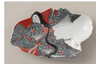
14代今泉今右衛門作 殿皿・姫皿