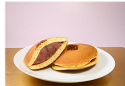
ひなまつり限定どら焼き 「桜ひめ」を販売します。