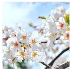
みはる 「三春の滝桜」植樹式 (2/8(土) 8時30分～)