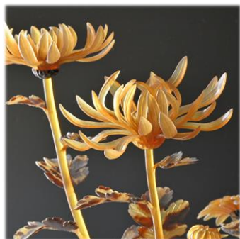
鍋島邸を彩った 花モチーフの工芸品