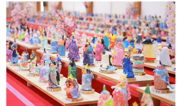
第11回 子どもびなの宴 小学生が作った約2,000体の ひな人形がお出迎え