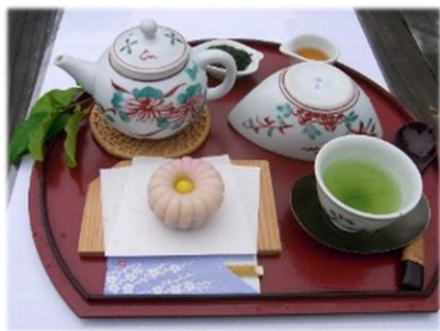
本格煎茶体験など