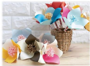
ペーパーフラワーづくり ワークショップ