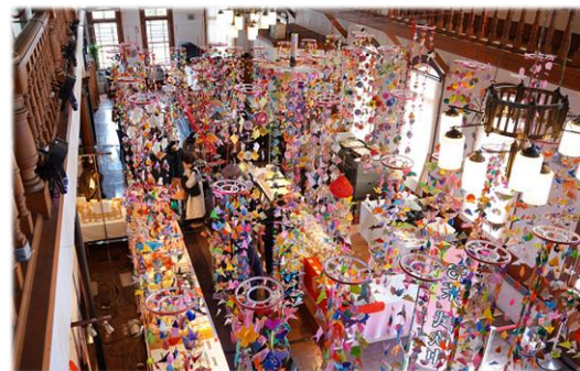
折り紙の吊るし飾り (循誘校区の皆さんが制作)