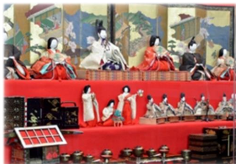
鍋島家歴代夫人のおひなさま