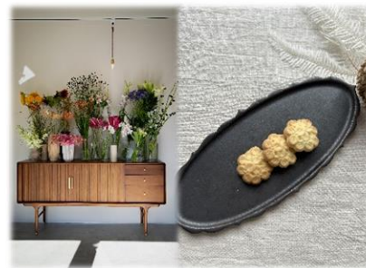
花やスイーツの販売