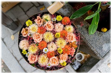
花手水などの会場装飾