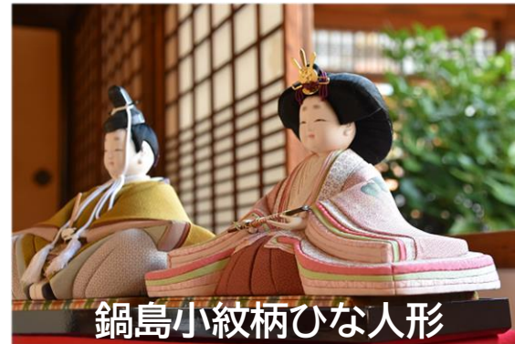
鍋島小紋柄ひな人形