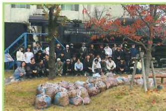
環境活動に協力する団体 として紹介します