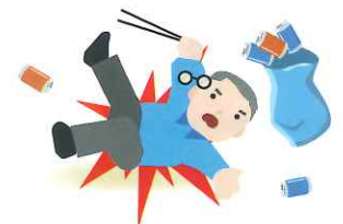
活動によるケガは、ボラン ティア保険を適用します