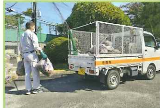
ごみの回収に伺います