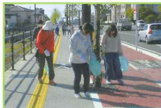
活動は、グループでも 1人でも可能です