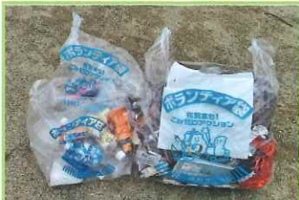
ボランティア袋をお渡し します