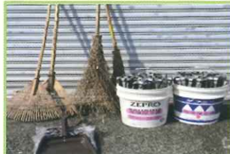
清掃道具を貸し出します