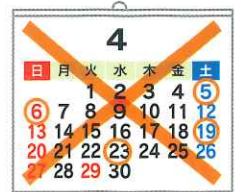
活動回数にノルマは ありません