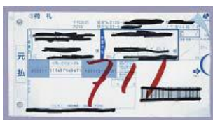
粘着紙 (複写伝票や圧着はがき)