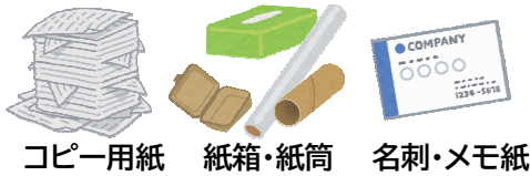
コピー用紙 紙箱・紙筒 名刺・メモ紙