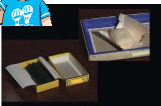
においのついた紙 (線香や洗剤の箱)