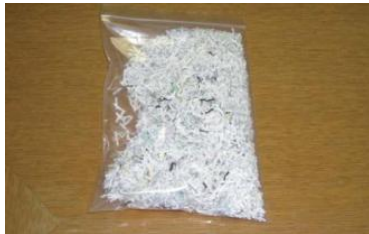
シュレッダー紙 (名刺サイズより 小さい紙)