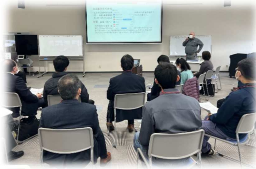
佐賀SDGs推進ネットワーク勉強会

佐賀市は、佐賀大学全学教育機構、リコージャパン株式会社マーケティング本部佐賀支社、佐賀SDGs官民連携円卓フォーラムと連携し、SDGsの目標達成に向けた人材育成及び実践的な行動を促進することを目的とし、佐賀大学の授業科目「佐賀SDGsグローバルアクションⅠ・Ⅲ」の一般開放や市内事業所等を対象とした「佐賀SDGs推進ネットワーク勉強会」(R5実績：年3回、延べ84人参加)を実施しました。引き続き、4者連携のもと、市内事業所等のSDGsへの取り組みを支援していきます。