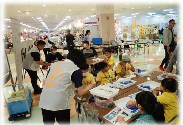
体験コーナー（ワークショップ） マイクロプラスチック万華鏡づくり