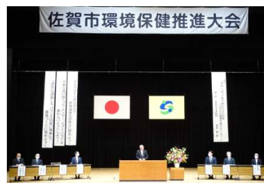
【写真】推進大会の様子