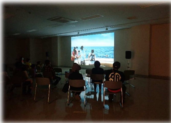
環境映写会 「プラスチックの海」

プラスチックごみの海洋流出については、近年、地球規模の問題となっています。気候変動の影響もあり、ここ数年、豪雨災害により有明海に面した佐賀市も毎回大きな影響を受けています。この問題は世界規模ではありますが、一人ひとりの意識や行動により抑制できることもあります。佐賀市では、10月にイオンモール佐賀大和にて海洋プラスチック問題に関する各種イベントを開催し、市民への啓発活動を行いました。