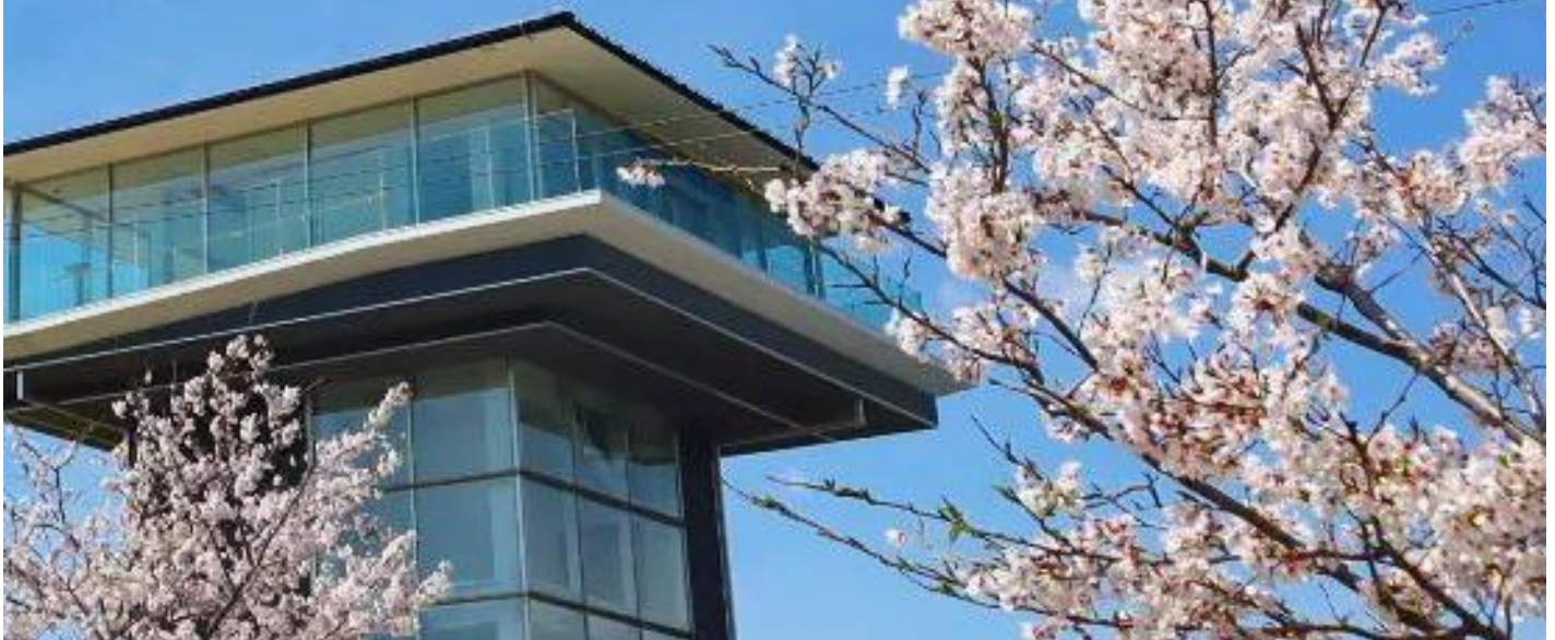
東よか千潟ビジターセンター「ひがさす」と桜