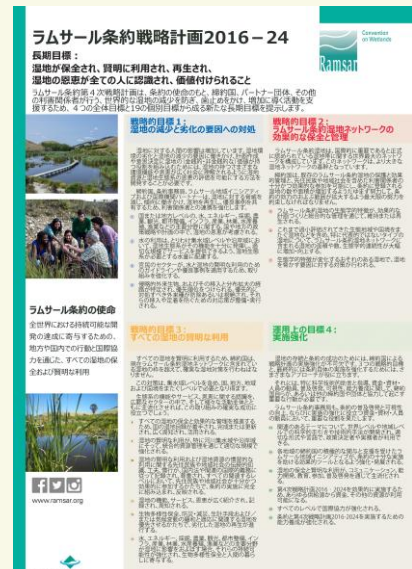
ラムサール条約戦略計画 2016-24 ポスター