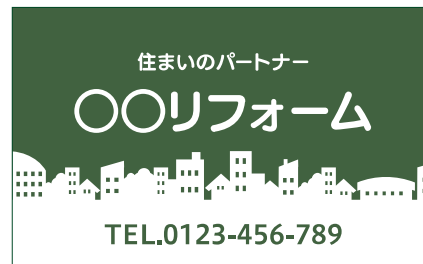
色数を絞り、適度なコントラストがある広告物