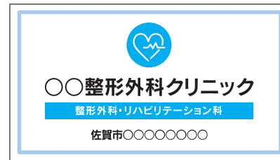
情報を整理し、十分な余白をとった広告物