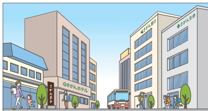
建築物の多い市街地

(令和6年度に開催した「屋外広告・サインミーティング」及び「屋外広告物講習会」の内容を参考に屋外広告の表示のポイントをまとめたものです)