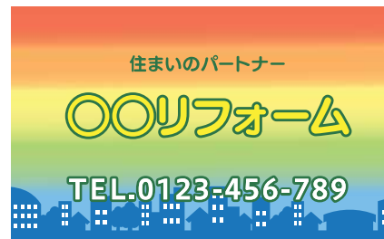
あいまいな配色の広告物