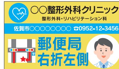
情報量が多く、余白の少ない広告物