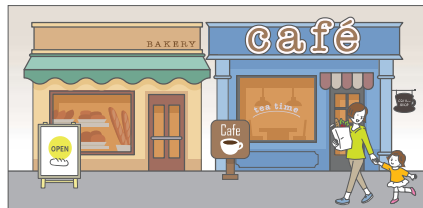
大きさや位置がばらばらの看板は、見にくくなることがあります