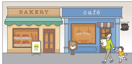
大きさや位置のそろった看板は統一感があり、見やすくなります