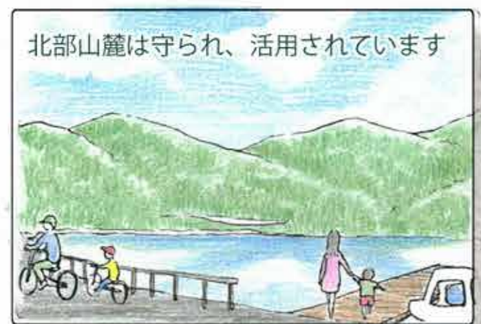
北部山麓は守られ、活用されています