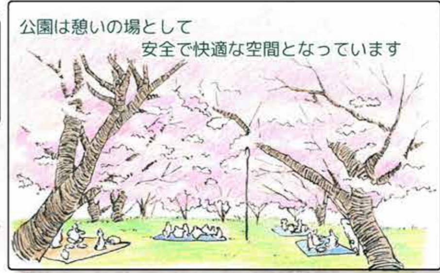
公園は憩いの場として 安全で快適な空間となっています