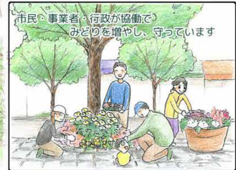
市民・事業者・行政が協働で みどりを増やし、守っています