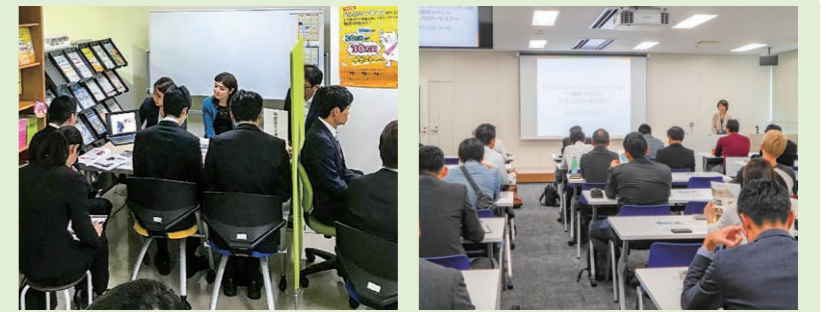
会社説明会の様子