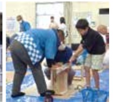
企業の強みを 生かした取り組み