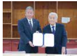
田島(株)と赤松校区との 指定避難所運営協定

事業者のみなさんも、まちづくりの主体として、自治会やまちづくり協議会などが行っている地域活動(環境保全活動や健康づくりなど)への積極的な参加や連携をお願いします。また、参加と協働のまちづくりについての出前講座も行っておりますので、是非ご活用ください。