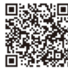
佐賀市まちづくり 自治基本条例 (佐賀市HP)