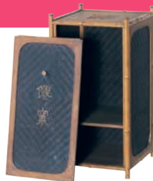
「仙窠」(模造品) (佐賀県立博物館蔵) 自分の死期を感じた晩年の売茶翁は、茶道具の行く末を案じ燃やしてしまったとの逸話も