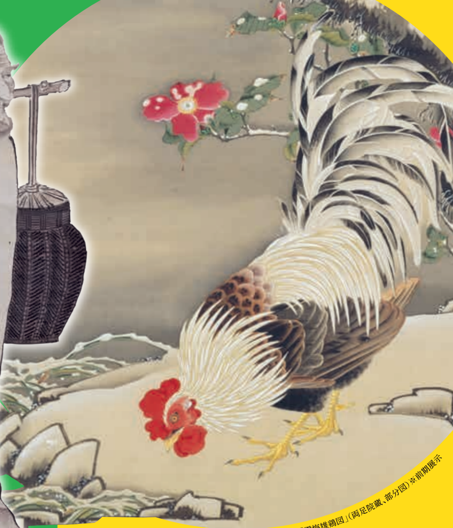
伊藤若冲筆「雪梅雄鶏図」(兩足院蔵、部分図)※前期展示