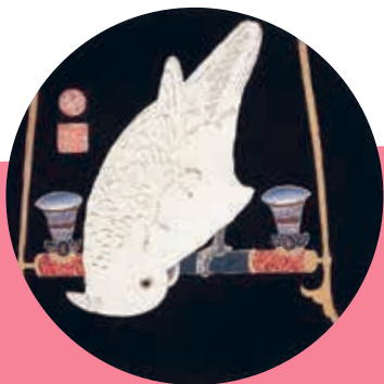
伊藤若沖作「鸚鵡図(花鳥図版)」 (平木浮世絵財団蔵、部分図) ※後期展示