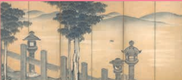
伊藤若沖筆「石灯籠図屏風」(京都国立博物館蔵)※後期展示