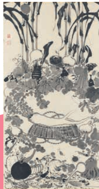
伊藤若沖筆「果蔬涅槃図」 (京都国立博物館蔵) 重要文化財 ※後期展示