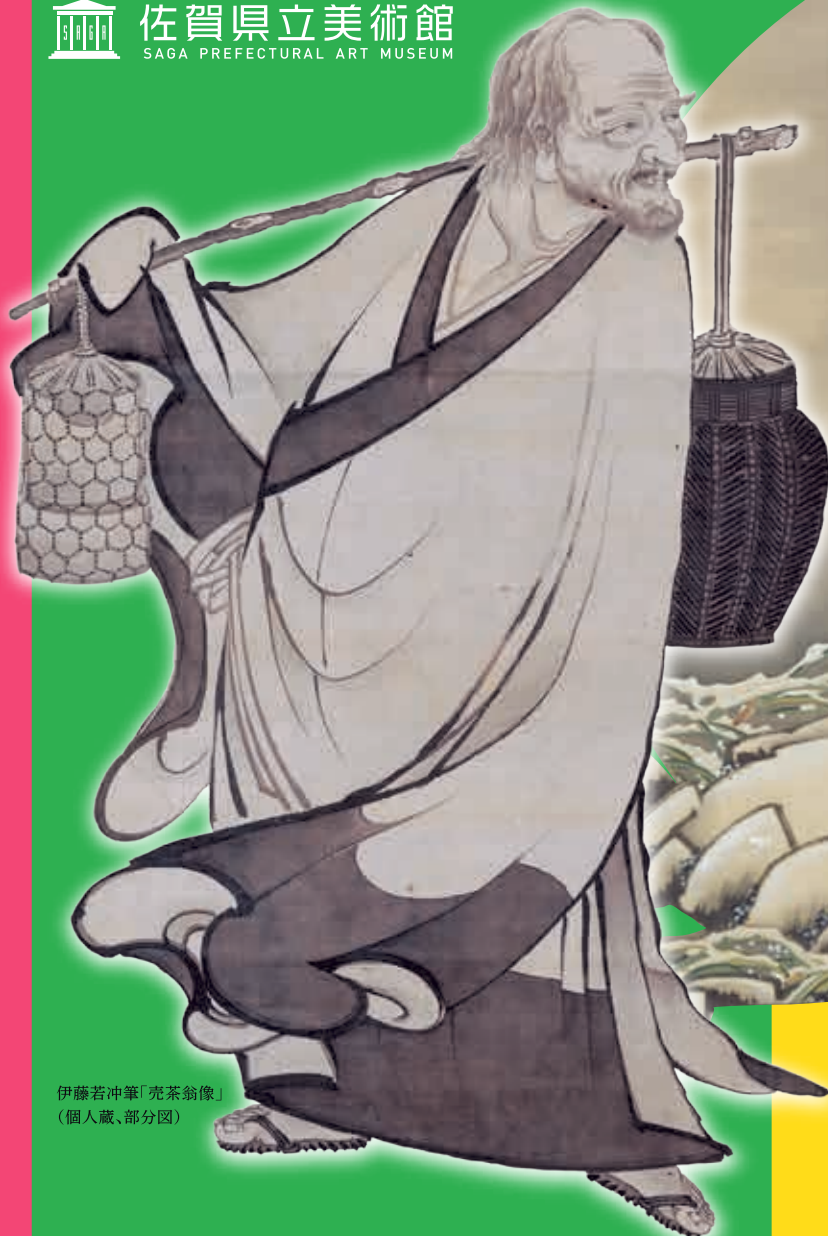
伊藤若冲筆「売茶翁像」 (個人蔵、部分図)