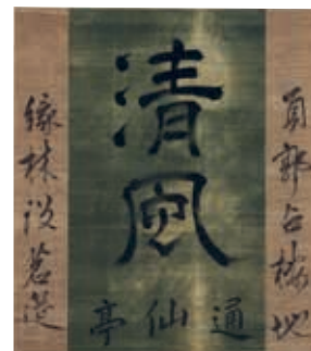
茶旗「清風」 (個人蔵)※後期展示 売茶翁が茶席「通仙亭」で掲げていた旗

ばい き おう 売茶翁 (1675~1763) 佐賀藩の支藩・蓮池藩に生まれる。出家して各地で修行をする中、従来の僧侶の在り方に疑問を感じるように、61歳(1735年)ごろ、京都で茶席「通仙亭」を開き煎茶をふるまう。その姿に共鳴するように、売茶翁の元には画家・書家・儒学者といった知識人・文化人たちが集い、交流を深めていった。