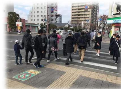
▲現地視察会で実際に歩いて、バスケットボール観戦