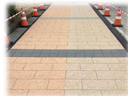
▲駅前広場に舗装サンプルを施工して検討会で確認