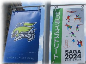
▲愛称「サンライズストリート」

愛称「サンライズストリート」、SUNRISE BOX、 SUNRISE POCKET、SS広場、バナーフラッグ、 トイレシェアリング、距離表示