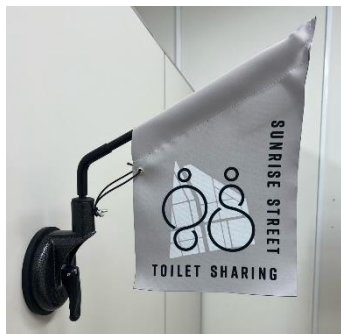
フラッグ (W200mm × H270mm)