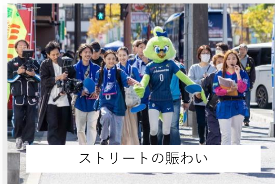
ストリートの賑わい