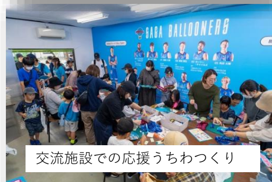
交流施設での応援うちわづくり