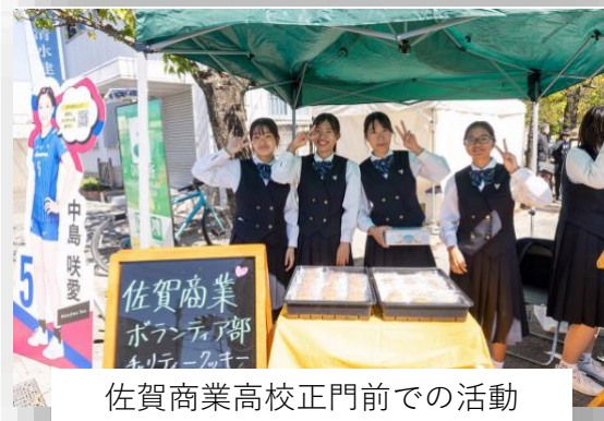
佐賀商業高校正門前での活動