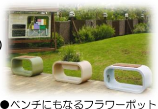
●ベンチにもなるフラワーポット