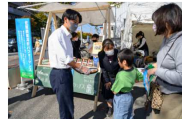
商業高校前の状況