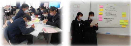
生徒によるワークショップの様子