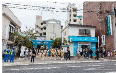
鎚流神社横の状況