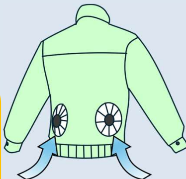
空調服・冷却バスト