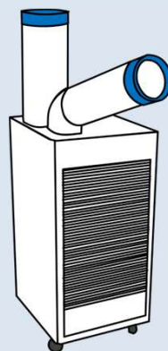
スポットクーラー