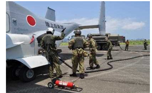
航空機への燃料補給・整備