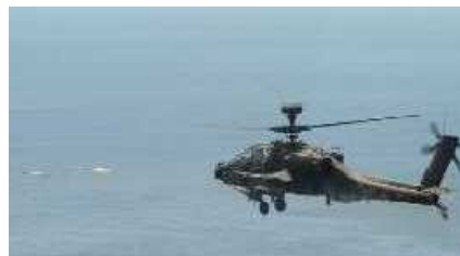
ヘリコプター火力戦闘訓練(非実射)