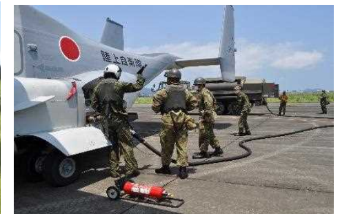
航空機への燃料補給・駐機等