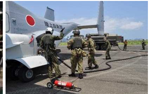
航空機への燃料補給・整備