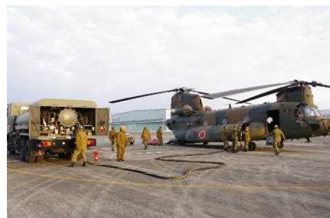
航空機への燃料補給・整備