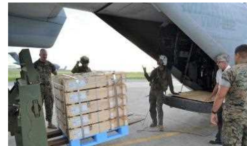
共同補給・輸送訓練 (航空機への積載)