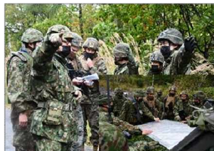
対着上陸戦闘訓練