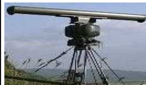
マリンレーダ※による沿岸監視訓練