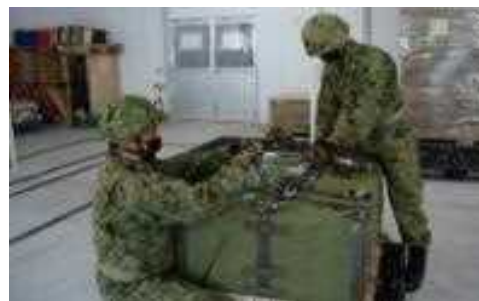
共同補給・輸送訓練