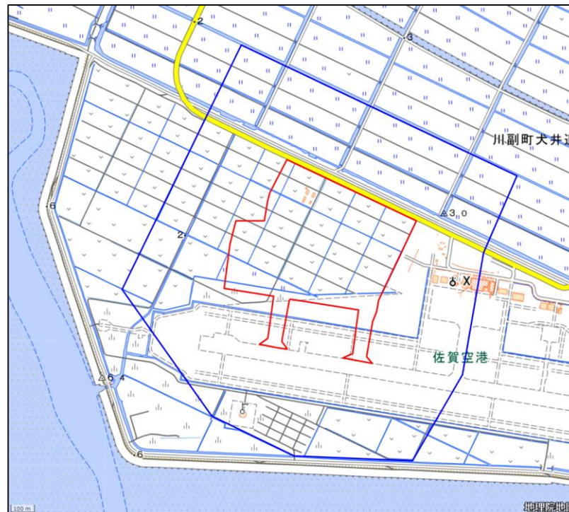
陸上自衛隊佐賀駐屯地