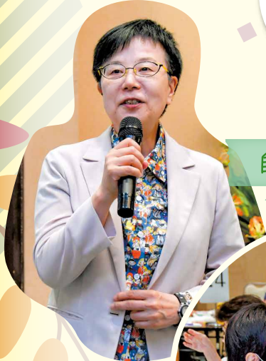
自治会等における

男らしさ、女らしさにとらわれず、自分らしく暮らせる社会。お互いに認め合い、個性と能力を発揮できる佐賀市の実現をめざしましょう。