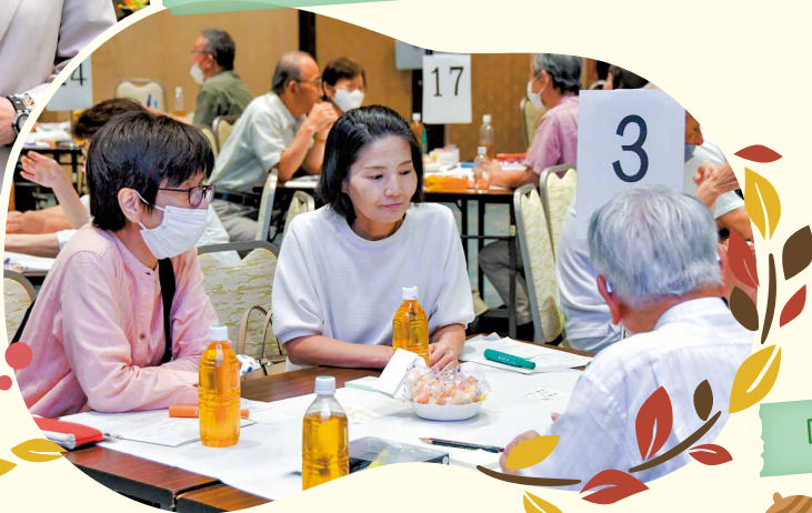
男女共同参画のためのシンポジウム