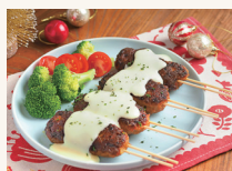
チーズハンバーグ串