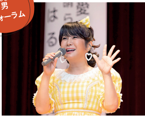
ひと・ひと 女・男 フォーラム