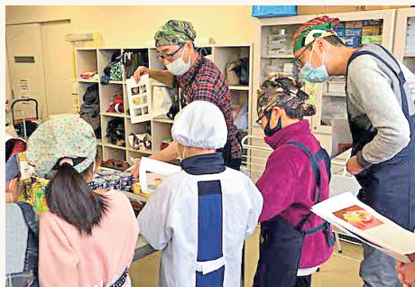
まず、料理の作り方を教わりました。パパも子どもたちも真剣です。