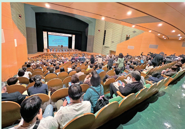
全国から2,000人以上が参加しました。