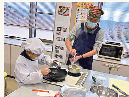
同時進行でスープもつくりました。