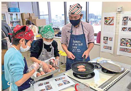
材料を混ぜ合わせて、焼いて、家族で協力してハンバーグをつくります。