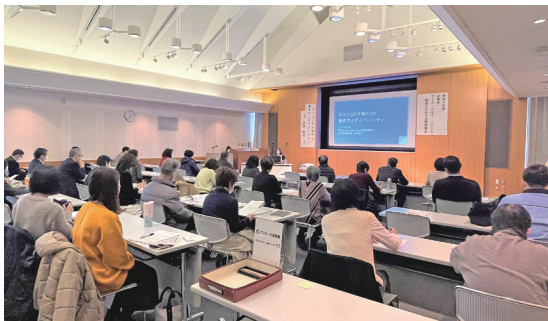
会場開催に加えて、後日録画配信も行い、多くの皆さんに受講していただきました。

女性管理職50%を達成しているある企業では、社員が若い時から徹底して男女のチャンスを均等にしています。また、「男性中心の企業では成長が止まる」という信念から、徹底したアンコンシャスバイアスの研修を行い、そのプログラムを公開している企業、男性社員の採用難から女性を採用した結果、新たな発想が生まれ事業が拡大した企業、男性は営業、女性は内勤という考え方を止め、ジョブローテーションを行うことで営業がのびた企業もあります。