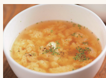
ふわふわ卵スープ