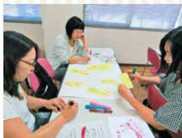
▲参加者がワークを通じて情報交換をしました