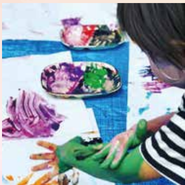
友だちの子どもたちと一緒にフィンガーペインティングをしました。五感をフルに使って、良い刺激になりました。

A はい。仕事が終わったらまっすぐ帰ってきて、子どもの面倒をみたり、食器を洗ったりしてくれます。最初は些細なことでもたくさんケンカもしましたが、その都度話し合っ、ルールを決めて、うまく協力し合えるようになりました。パパがいつも遊んでくれるので、長男はすっかりパパっ子に。保育園への送り迎えはなるべく私がして、長男と二人だけで過ごす時間を確保するようにしています。