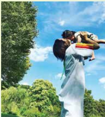
晴れた日のお出かけは気持ちいいですね。自然に触れて、子どもたちもご機嫌です。

上の子のお世話をしている間に転んだり、ぶつかったりするので、「そっちに行っちゃダメ!」「さわっちゃダメ!」など大声で叫んだりして、毎日あわただしく過ごしています。夜に天使のような子どもたちの寝顔を見て、怒りすぎたなと反省することもあります。