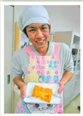
初めてできた卵焼きに 満足そう♪