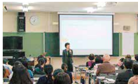
▲市とアバンセの共同で開催しました

女性議員が増えるためには、女性議員志望者の人材育成も必要な柱であることを話されました。そのためには、3つのC（Confidence：自信、Capacity：スキルの習得、Community：仲間とつながる）を身に付けさせるトレーニングをすることの必要性を説かれました。ジェンダー問題に気付き、自己肯定感を高め、将来のキャリアの一つとして考え、政治で解決したい「政策課題」を見つけ、同じ志をもつ仲間と議論するなどして、政治参画への意識を高めていくことが大切であることを主張されました。