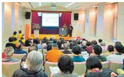
▲多くの方にご参加いただきました

この数年大規模自然災害が急増している中で、防災・減災・災害対応には「ジェンダーの視点」が欠かせません。それは、災害が与える影響が男性と女性では異なるからです。生物学的にも、社会的・文化的に形成されたものも違うので、抱える困難も支援ニーズも異なるのです。また、災害被害者が「尊厳のある避難生活」を送れるようにするための最低基準、『スフィアプロジェクト』を知っておくことも大切です。