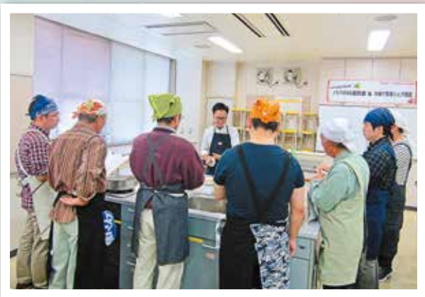
真剣に講師の説明を聴く参加者達