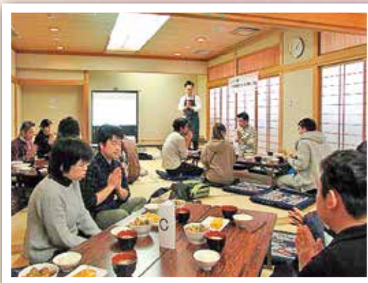
みんな揃っていただきます☆