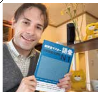
JLPTに向けて、何冊もの教科書を使って勉強しています。

このように、私にとって難しい日本語ですが、諦めずに勉強を続けます。外国語を勉強している皆さんと一緒に頑張りましょう！