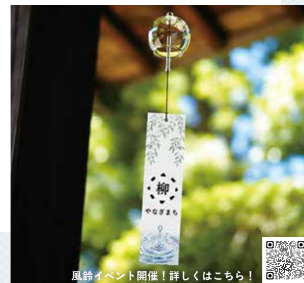
風鈴イベント開催！詳しくはこちら！

6月からはロゴをあしらった約1,000個の風鈴が柳町を彩ります。涼やかな音色とともに街並みを散策し、佐賀の魅力に触れてみませんか？