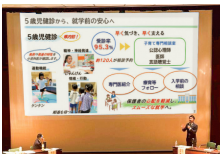
4月11日に行われた発達障害支援研究セミナーの様子

「うまくいかない理由を、こどもの問題にしない」。専門家との対話で深く共感した視点です。大切なのはこどもを変えるのではなく、周りの環境を整えること。市では1か月児や5歳児健診で小さな変化に早く気づき、支援へつなげます。学校では、小学校から中学校へ個別の(教育)支援計画を100%引き継ぎます。