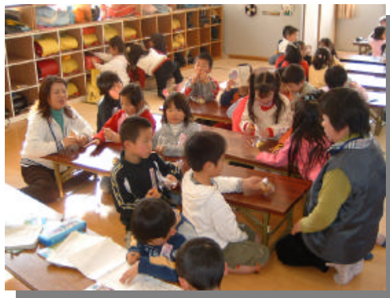
放課後児童クラブ

その中で保護者が運営の主体となる運営協議会の設立を進め、開設日数及び開設時間等について検討し運営しています。