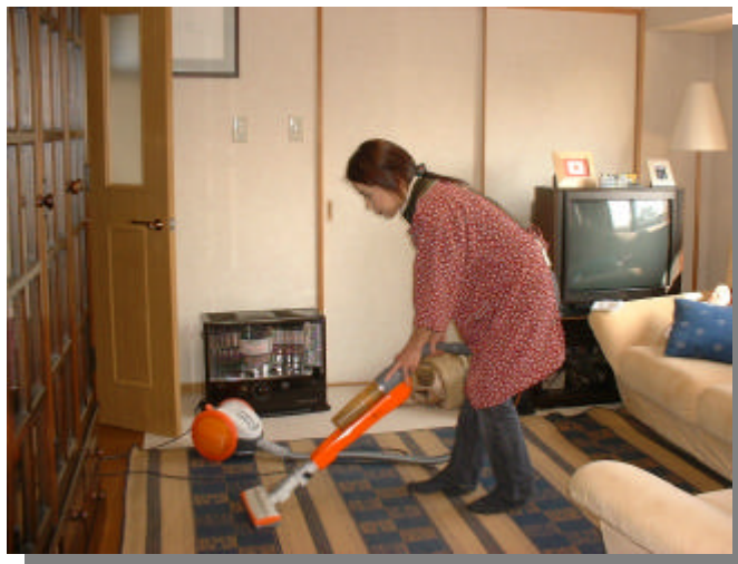
サポートママ援助の様子

出産後や、妊娠中で切迫流産等により自宅安静の必要な人で、実家や家族等の支援が望めず、一人で困っている母親に、家事や育児のお手伝いをする「サポート・ママ」を紹介します。